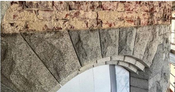
Kuva 3. Kivisaumojen avausta.

Osa Kansallismuseon julkisivusta on graniittikiveä. Kivien saumat avataan ja puhdistetaan. Tämän jälkeen kivet saumataan uudestaan.