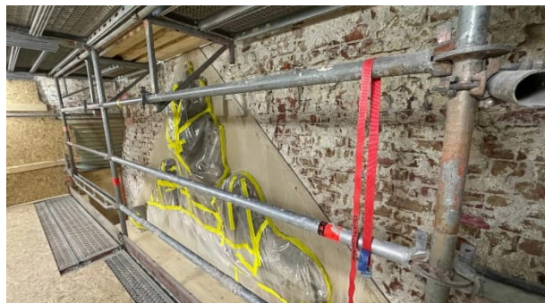
Kuva 6. Julkisivun reliefit suojattu ja eristetty.