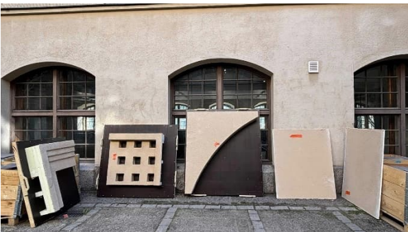
Kuva 4. Halkopihan akustorappausmalleja.

Osa Kansallismuseon julkisivusta on graniittikiveä. Kivien saumat avataan ja puhdistetaan. Tämän jälkeen kivet saumataan uudestaan.