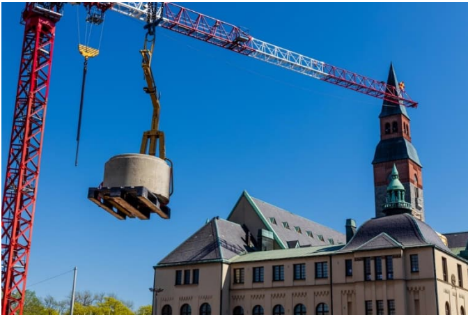
Kuva 7.

Kansallismuseon uuden laajennusosan peruskiven muuraus, oli viikon 20 perjantaina Atlas-hankkeen työmaalla. Tilaisuudessa valettiin aikakapseli peruskiveen. Aikakapselissa oli mm. presidentti Alexander Stubbin tervehdys tulevaisuuteen ja päivän Helsingin Sanomat. Peruskiven muurauksen suoritti Tiede- ja kulttuuriministeri Sari Multala. Virallisen tilaisuuden jälkeen vieraillla oli mahdollisuus päästä tutustumaan myös Kansallismuseon peruskorjaustyömaahan. Työmaa on historiallisuutensa takia herättänyt paljon kiinnostusta, ja työmaalla käykin aika ajoon vierailijoita.