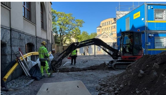
Kuva 9. Kaivuutyöt käynnissä.

Kansallismuseon uuden laajennusosan peruskiven muuraus, oli viikon 20 perjantaina Atlas-hankkeen työmaalla. Tilaisuudessa valettiin aikakapseli peruskiveen. Aikakapselissa oli mm. presidentti Alexander Stubbin tervehdys tulevaisuuteen ja päivän Helsingin Sanomat. Peruskiven muurauksen suoritti Tiede- ja kulttuuriministeri Sari Multala. Virallisen tilaisuuden jälkeen vieraillla oli mahdollisuus päästä tutustumaan myös Kansallismuseon peruskorjaustyömaahan. Työmaa on historiallisuutensa takia herättänyt paljon kiinnostusta, ja työmaalla käykin aika ajoon vierailijoita.