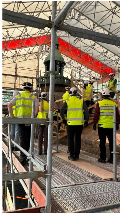
Kuva 8. Peruskorjaustyömaan esittelyä viikolla 21.

www.facebook.com/kansallismuseontyomaa , www.senaatti.fi/kansallismuseontyomaa , www.ncc.fi/projektit/kansallismuseon-peruskorjaus-helsinki/