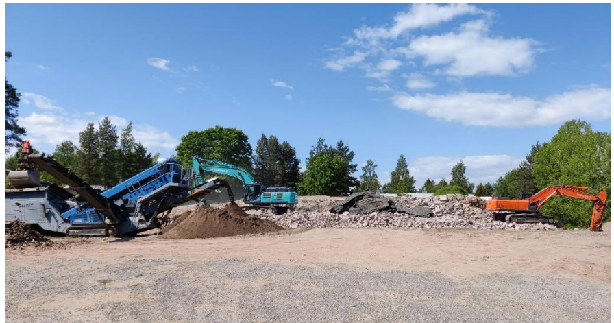
Puiden ja kasvillisuuden poisto naapuritonteilla Valokuva työmaalta 2.6.2021

Töitä joudutaan edelleen jatkamaan normaalia työaikaa (klo. 7.00 – 15.30) pidempään, johtuen seulonnan määrän kasvusta sekä maankaivun yhteydessä ilmenneiden muiden töitä hidastavien tekijöiden vuoksi. Maamassojen seulonta, maankaivu ja kuljetukset sekä louhinta varten tehtävät poraukset ja louhinta (räjäytykset) jatkuvat arkisin kello 18.00 saakka.