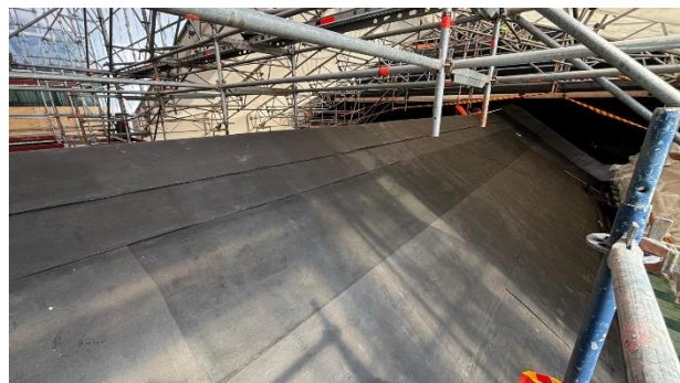
Kuva 1-2. Kumibitumikermin asennusta.