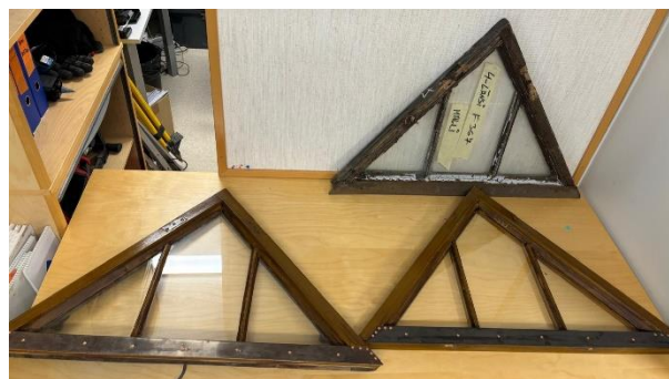
Kuva 6-7. Puuikkunoiden kuntokatselmusta ja ikkunoiden kunnostusmalleja.