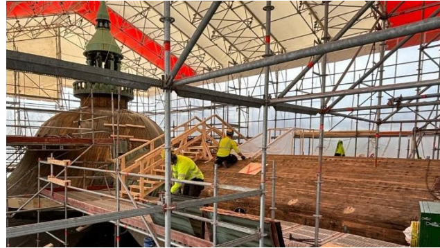
Kuva 3-5. Vesikaton purkutyöt ovat 1. lohkon osalta loppusuoralla.

Kansallismuseon puuikkunat ovat yhtä vanhoja kuin itse museorakennus, niiden kuntokatselmuksia aloitettiin viikolla 18. Katselmukseen osallistuivat NCC:n työnjohton lisäksi kunnostusurakoitsija sekä arkkitehti. Tarkastettavia, kunnostusurakkaan kuuluvia ikkunoita on yhteensä yli 200, vaikka kunnostuksia on tehty kattavasti vuosien varrella. Ennen varsinaista tarkastusta työnjohtaja valmistelee kierroksen laittamalla jokaiseen ikkunaan ikkunasuunnitelmat, joihin vielä tarkennetaan tarvittavat toimenpiteet. Puuikkunoiden kunto on hyvin vaihteleva ja siihen on vaikuttanut mm. se, miten alttiina ikkuna on ollut sääolosuhteille. Ikkunat pyritään säilyttämään kunnostuksen avulla mahdollisimman alkuperäisessä ulkoasussaan, samalla parantaen ikkunoiden toimivuutta ja kestävyyttä.