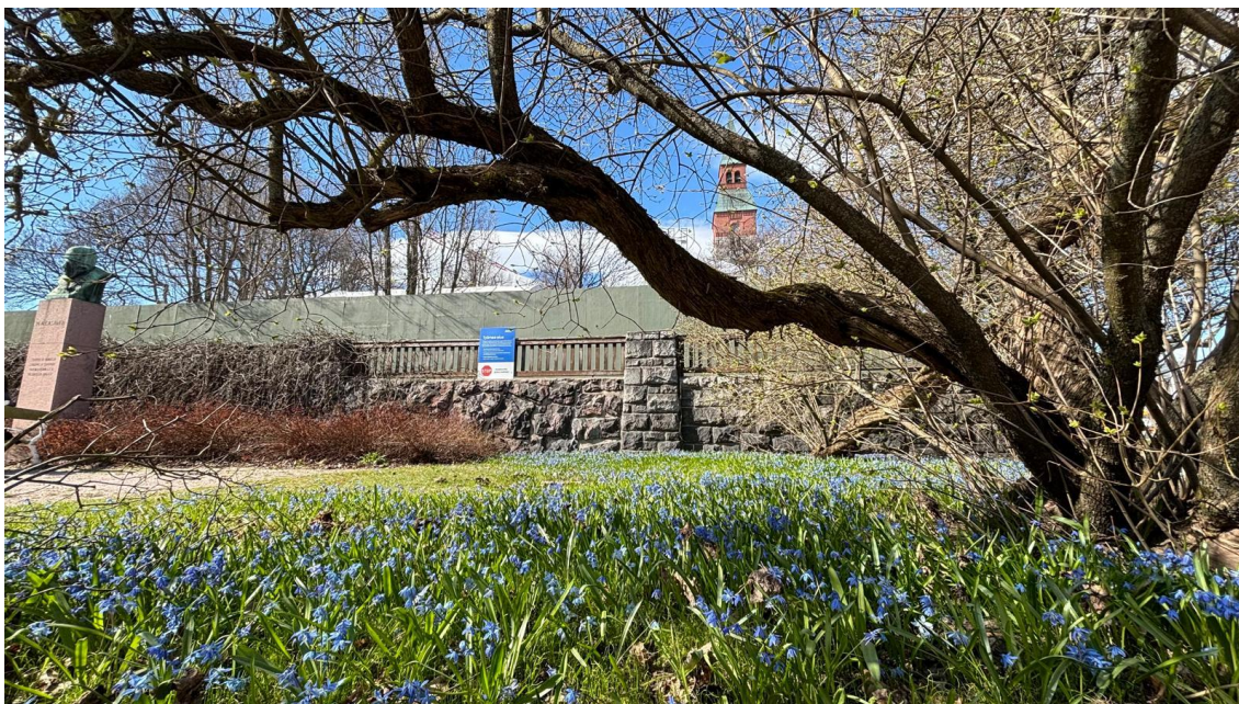
Kuva 7. Lämmin sää sai luonnon heräämään.

Työmaa-alueella suoritetaan kaivuutöitä viikolla 21-24 uusia lämpölinjoja varten. Kaivuutyöt eivät aiheuta häiriötä työmaan ulkopuolelle. Töitä yhteensovitetään Atlas -hankkeen kanssa.