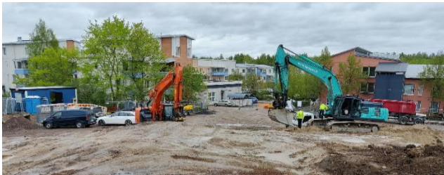
Valokuva työmaalta 20.5.2021

Louhintaa varten tehtävät poraukset alkavat tämän viikon aikana ja louhinta (räjäytykset) aloitetaan ensi viikon keskiviikkona 26.5.2021. Porauksesta ja louhinnasta aiheutuu meluhaittaa. Louhintatöiden kesto on arviolta noin neljä (4) viikkoa ja niitä tehdään maanantaista perjantaihin pääsääntöisesti kello 7.00 – 15.30 välisenä aikana. Pyydämme huomioimaan poraus- ja louhintatöistä aiheutuvat meluhaitat esimerkiksi mahdollisesti tekemienne etätöiden osalta.